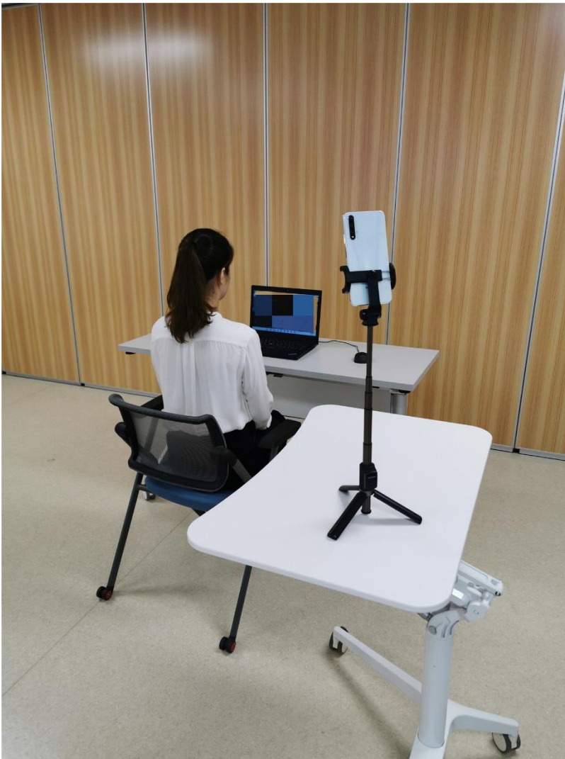
考生面试设备（含摄像头、话筒、扬声器）及侧面摄像头位置图