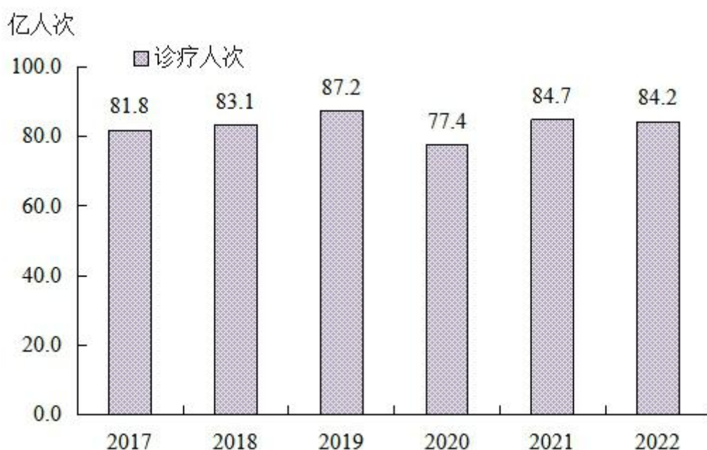
图4 全国医疗卫生机构诊疗量

2022年，公立医院诊疗人次31.9亿（占医院总诊疗人次的83.4%），民营医院诊疗人次6.3亿（占医院总诊疗人次的16.6%）（见表5）。